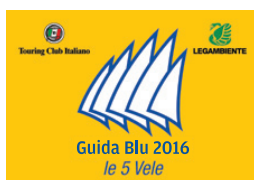
5 Vele Legambiente 2016